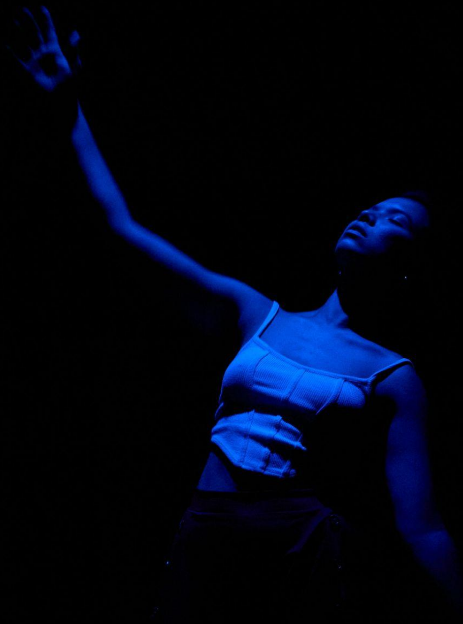
TABLEAU 5 : sous la pluie