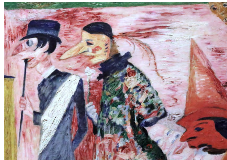
Personnages devant l'affiche de « la gamme d'amour » (détail), James Ensor (1860-1949), Bruxelles Musées Royaux des Beaux Arts de Belgique.