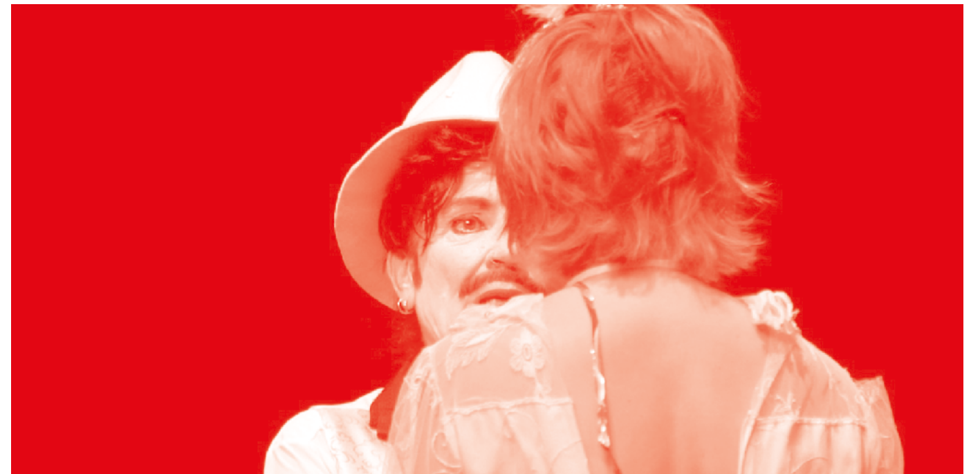
Don Juan, un cœur à aimer la terre entière