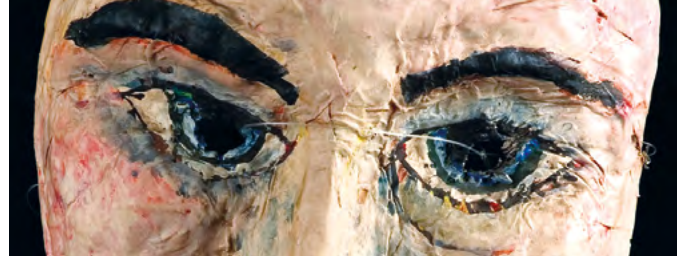
Masque pour Don Louis (détail), Michel de Ghelderode

Et puisque dans la vraie vie Don Juan n'est pas mort, dans notre version (inspirée par La Dernière Nuit de Don Juan , d'Edmond Rostand), Don Juan ne meurt pas à la fin. Il pactise avec le Diable , et revient d'outre-tombe :